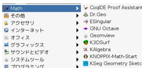
図 2: KNOPPIX/Math Start