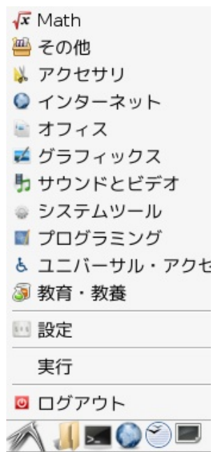
図 1: lxde メニュー

A. 図 1 にあるように lxde パネル (一番下のバー) の左端にあるアイコンをクリックすると lxde のメインメニューが出現します.